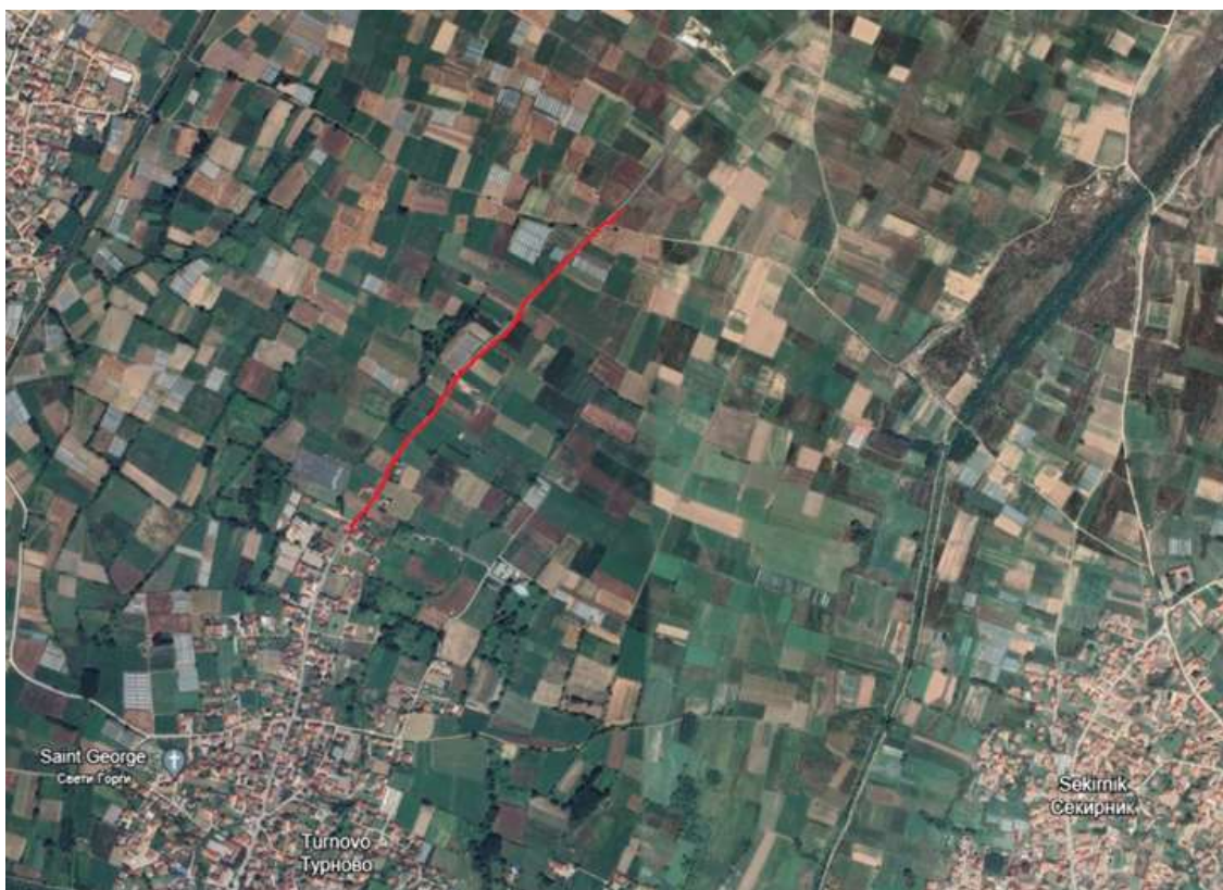
Слика 4 Локација на дел од локалниот пат Турново - Иловица во општина Босилово (црвена линија)