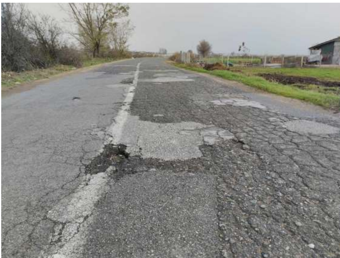
Слика 8 Постоечка состојба од локалниот пат Турново - Иловица во општина Босилово за време на теренската посета на ден 29.11.2023