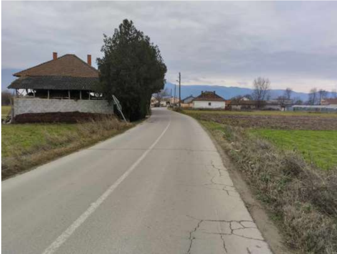
Слика 3 – Влез на село Турново (дрвја чемпрес)

Локацијата на дел од локалниот пат Турново – Иловица е прикажана на 4, а на 5, 6 и 7 е прикажана постоечката состојба на локалниот пат.