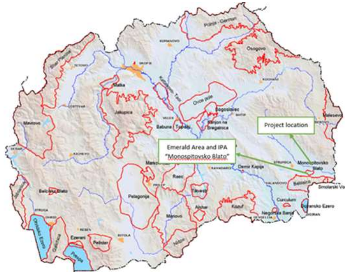
Слика 10 Локацијана локалниот пат Турново – Иловица в оопштина Босилово односно релевантното заштитено подрачје „Моноспитовско Блато“

проектната локација до најблиското заштитено подрачје, не се очекуваат влијанија врз заштитените подрачја.