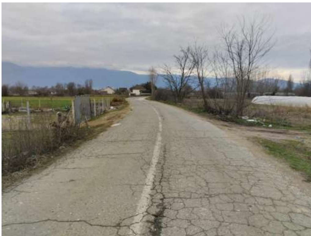
Слика 2 – Влез кон мала штала