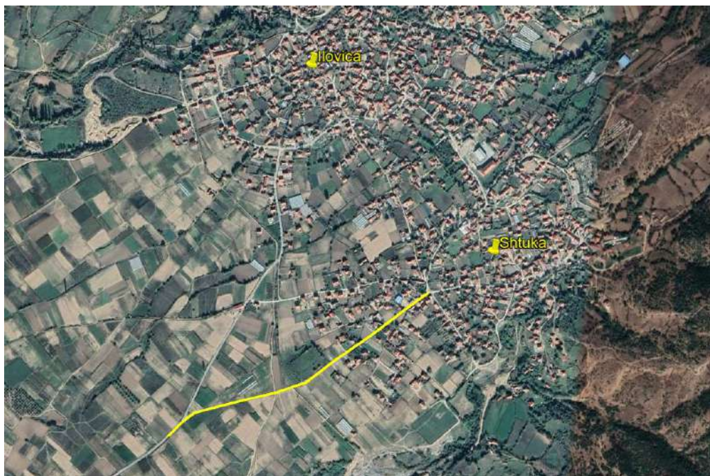
Слика 6 Локација на локалната улица во н.м. Штука на КП 1543/1

Локалната улица се наоѓа во рурална средина и долж трасата има комбинација од приватни куќи и земјоделски ниви. Локацијата на локалниот пат е прикажана на слика 6.