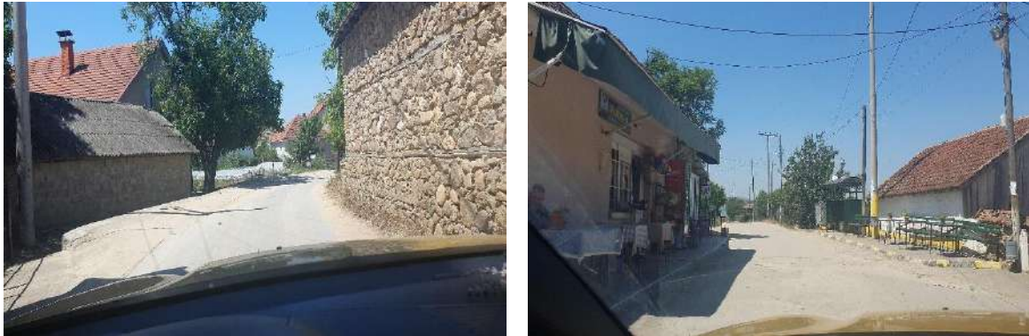
Слика 5 Моментална состојба на локалните улици во н.м Иловица на КП 5137 и КП 3273/2

Моменталната состојба на локалната улица е асфалтирана, но е во лоша состојба, со надолжни и попречни пукнатини и оштетување на крокодилската кожа. Патот е со ширина од 5 метри (2x2,5 m). Сегашната ситуација е прикажана на Слика 5.