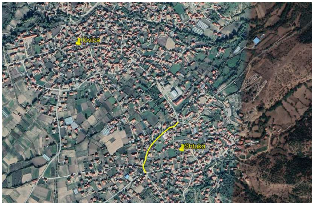
Слика 8 Локавија на локалната улица во н.м. Штука на КП 313

Моменталната состојба на локалната улица е асфалтирана, но е во лоша состојба, со надолжни и попречни пукнатини и оштетување во вид на крокодилска кожа. Патот е со ширина од 5 метри (2x2,5 m). Сегашната ситуација е прикажана на Слика 9.