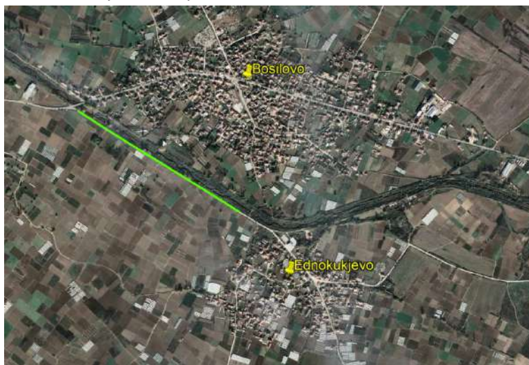
Слика 2 Локација на локалната улица во н.м. Еднокуќево до локалниот пат А4 која ќе биде реконструирана

По јужниот дел на трасата има само земјоделски површини, а кон северниот дел од трасата тече реката Струмица. Трасата започнува во северниот дел на н.м. Еднокуќево и завршува на раскрсницата со локалниот пат А4. Од североисток патот се поврзува со село Босилово со патот А4. Локацијата на локалната улица е прикажана на слика 2.