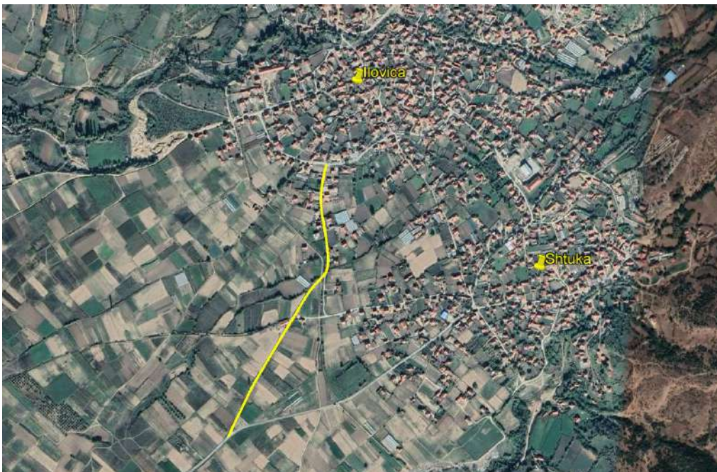
Слика 4 Локација на локалната улица во н.м. Иловица на КП 5137 и КП 3273/2

Локалната улица е лоцирана во рурална средина и долж трасата има комбинација од приватни куќи и земјоделски ниви. Локацијата на локалниот пат е прикажана на слика 4.