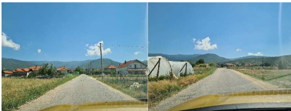
Слика 7 Моменталната состојба на локалната улица во н.м. Штука на КП 1543/1

Моменталната состојба на локалната улица е асфалтирана, но е во лоша состојба, со надолжни и попречни пукнатини и оштетување во вид на крокодилската кожа. Патот е со ширина од 5 метри (2x2,5 m). Моменталната ситуација е прикажана на слика 7.