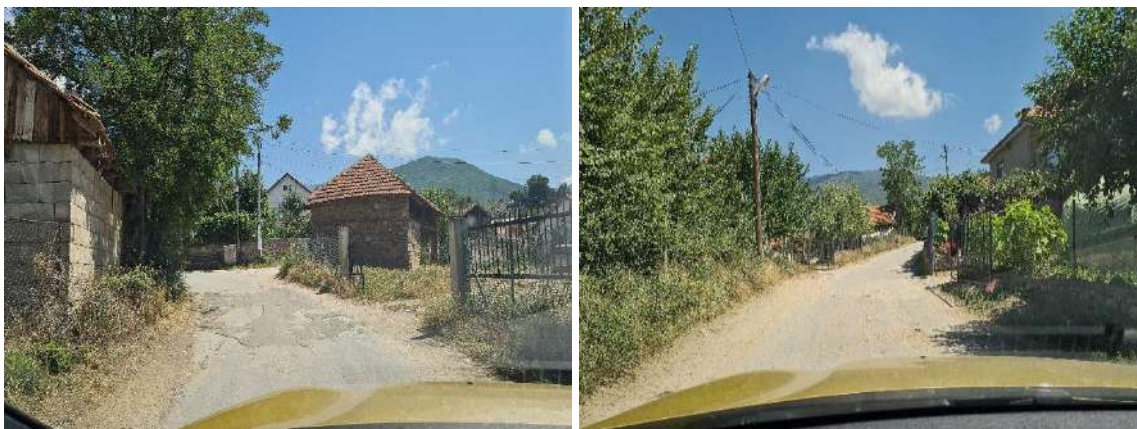
Слика 9 Моменталната состојба на локалната улица во н.м. Штука на КП 313

Моменталната состојба на локалната улица е асфалтирана, но е во лоша состојба, со надолжни и попречни пукнатини и оштетување во вид на крокодилска кожа. Патот е со ширина од 5 метри (2x2,5 m). Сегашната ситуација е прикажана на Слика 9.